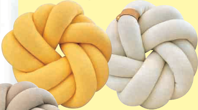
VERWICKLUNGEN Echte Hingucker sind die Knotenkissen mit ihrem frechen Dessin. Die vergisst so schnell niemand... Je ca. 70 Euro; Adorist über www.desiary.de