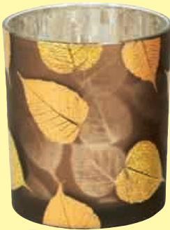
LICHTSTIMMUNG Durch das schöne Glas-Design mit fallendem Laub schimmert bei diesem Windlicht das Kerzenlicht und zaubert goldene Reflexe. Ca. 12 Euro; Exner, www.exner-collection.de