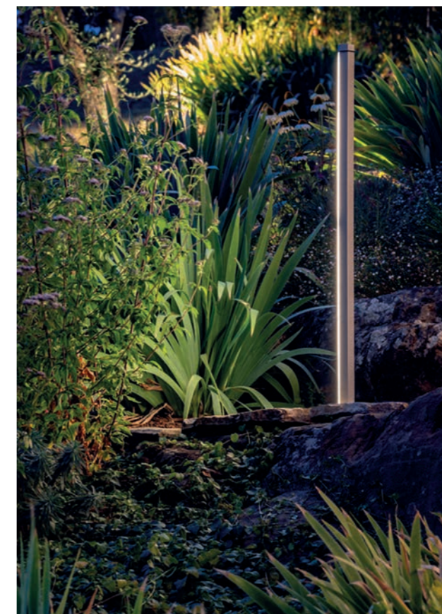
ESAGONO ist eine Leuchte, die sich durch eine extreme Anwendungsvielseitigkeit auszeichnet. Dank ihres linearen Designs kann sie sowohl an der Basis von Wänden oder Hecken verlegt als auch als Poller für Gärten oder direkt an der Wand eingesetzt werden. Die Leuchte fügt sich elegant in den architektonischen Kontext ein. Preis auf Anfrage, platek.eu