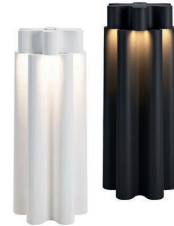
Die EONO Akkutischleuchte von Sompex ist ein Statement für modernes Design. Mit ihrem schlichten, aber außergewöhnlichen Design, das an eine abstrakte Blume erinnert, die sich öffnet, sobald man den Lampenschirm dreht, erfüllen sie die Umgebung mit warmem Licht. Gefertigt aus hochwertigem Aluminium ist die Leuchte für den Innen- und Außenbereich geeignet. Es gibt sie in Weiß und Schwarz. Um 149 Euro, sompex.de // trendxpress.org

Windlichter, wie diese von fink living, schaffen auf Balkon und Terrasse mit warmen Lichteffekten eine gemütliche Atmosphäre. Preise auf Anfrage, fink-living.de // trendxpress.org