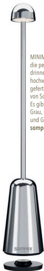
MINIMAX Akkutischleuchte – die perfekte Kombination für drinnen und draußen! Aus hochwertigem Aluminium gefertigt, ist diese Tischleuchte von Sompex äußerst vielseitig. Es gibt sie in Weiß, Schwarz, Grau, Olivgrün, Sand, Chrom und Gold. Um 99 Euro, sompex.de // trendxpress.org

Gehen wir von der Terrasse in den Garten: Mit der passenden Beleuchtung werden einzelne Bäume und Sträucher zum optischen Hingucker und verleihen dem Garten Tiefe. Einbauleuchten im Boden und Erdspeißleuchten zaubern wunderschöne Effekte. Indirekte Lichtquellen sorgen für stimmungsvolle Lichtinseln und reflektieren den Strahlenkegel entlang von Gartenmauern oder Natursteinelementen. ■