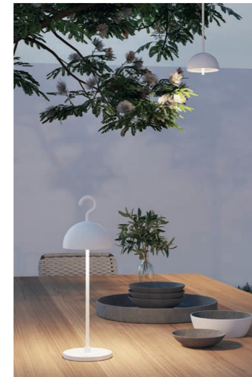
Das Modell SALERNO von Leonardo LIVING passt sich stufenlos allen Stimmungen an. Ein leichter Druck auf die Leuchte genügt, um sie an- und auszuschalten oder zu dimmen. Mit verschiedenen Lichtstimmungen bringt die Designleuchte in transparenter Optik behagliches Flair in jedes Ambiente – egal, ob in- oder outdoor. Um 99 Euro, leonardo-living.de // trendxpress.org

Das Spiel mit Licht und Schatten sowie direktem und indirektem Licht schafft Atmosphäre und setzt ganz gezielt bestimmte Abschnitte in Szene. So ist eine Grundbeleuchtung ebenso wichtig wie der Einsatz von punktuellen Effekten. Direktes Licht – hierfür eignen sich Strahler sehr gut – wird vor allem beim Grillen und Essen eingesetzt. Man möchte schließlich sehen, was man isst. Indirektes Licht ist unaufdringlich und weich und für die Wohlfühlatmosphäre verantwortlich. Mit dimmbaren LED-Terrassenleuchten lässt sich die Helligkeit nach Bedarf regulieren. Möbel oder Pflanzen können mit akzentuiertem Licht wie LED-Spots in Szene gesetzt werden. ▶