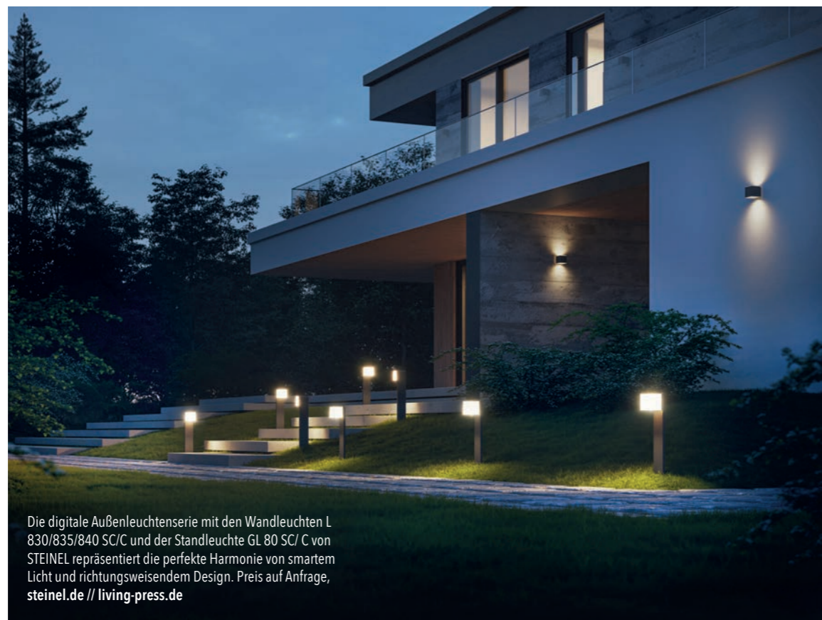
Die digitale Außenleuchtsenserie mit den Wandleuchten L 830/835/840 SC/C und der Standleuchte GL 80 SC/C von STEINEL repräsentiert die perfekte Harmonie von smartem Licht und richtungweisendem Design. Preis auf Anfrage, steinel.de // living-press.de