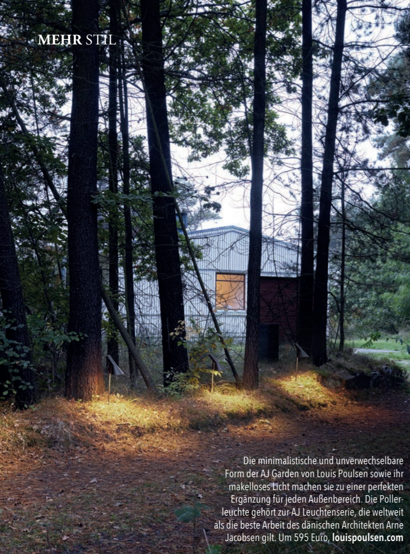
Die minimalistische und unverwechselbare Form der AJ Garden von Louis Poulsen sowie ihr makellostes Licht machen sie zu einer perfekten Ergänzung für jeden Außenbereich. Die Pollerleuchte gehört zur AJ Leuchtserie, die weltweit als die beste Arbeit des dänischen Architekten Arne Jacobsen gilt. Um 595 Euro, louispoulsen.com

► Terrassenbeleuchtung am Boden sorgt vor allem dafür, dass man im Dunkeln nicht stolpert oder eine Stufe übersieht. Sie macht die Terrasse in erster Linie sicherer, indem sie Orientierung bietet. LED-Spots und LED-Bodeneinbauleuchten eignen sich für die Ausleuchtung des Bodens besonders gut. Man kann sie mit schönen Stehleuchten ergänzen.