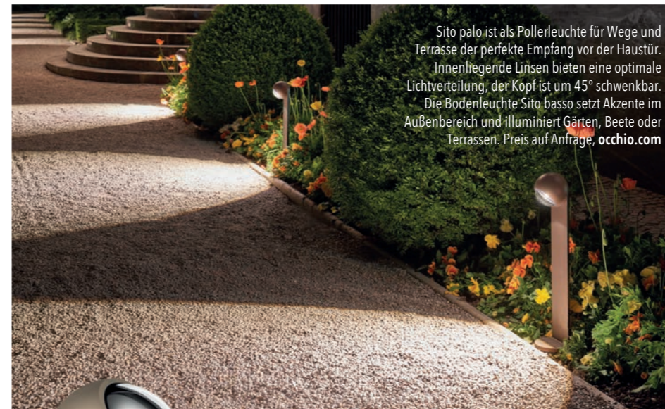
Sito palo ist als Pollerleuchte für Wege und Terrasse der perfekte Empfang vor der Haustür. Innenliegende Linsen bieten eine optimale Lichtverteilung, der Kopf ist um 45° schwenkbar. Die Bodenleuchte Sito basso setzt Akzente im Außenbereich und illuminiert Gärten, Beete oder Terrassen. Preis auf Anfrage, occhio.com