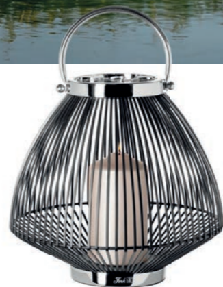
Laterne FLIX: Ein filigranes Drahtgeflecht in mattschwarzer Färbung sorgt für faszinierende Lichtspiele der Kerzenflamme. Jede Laterne wird in Handarbeit gefertigt. Um 119 Euro, fink-living.de // trendxpress.org

Endlich Sommer. Mit aller Macht zieht es uns nach draußen. Es gibt nichts Schöneres, als die Tage und Sommerabende unter freiem Himmel zu verbringen und bei angenehmen Temperaturen mit Familie und Freunden das Leben zu genießen. Mit den richtigen Accessoires und vor allem auch der richtigen Beleuchtung werden Terrasse, Balkon und Garten zum gemütlichen Rückzugsort.