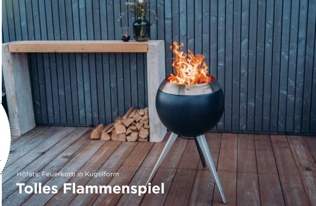
Höfats: Feuerkorb in Kugelform

„Moon“ von Höfats punktet mit seiner Optik in Kugelform sowie mit einer revolutionären Brennertechnolo- gie nach dem Holzvergaserprinzip. Die doppelte Wand ermöglicht eine dreifache Luftzufuhr, was für ein raucharmes Feuerspiel sorgt. Der Feuerkorb ist mit niedrigem und ho- hem Fuß erhältlich, optional gibt es einen Funkenschutz und einen Deckel. www.hofats.com