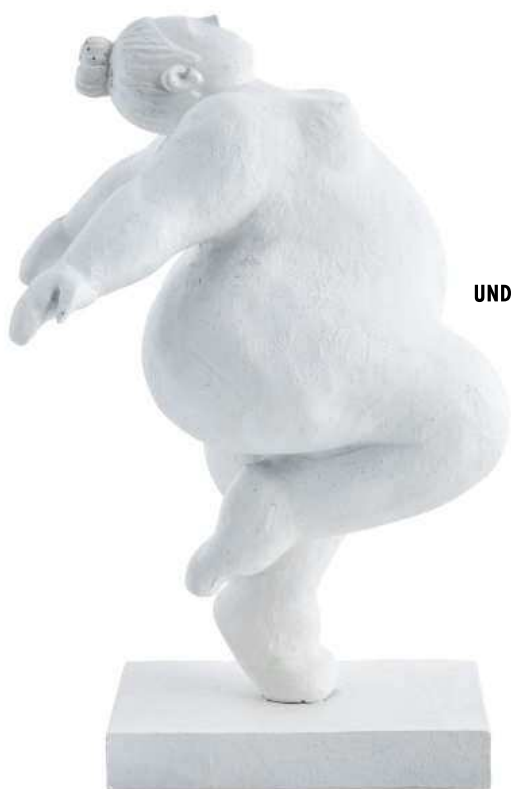
UND ALLE NUR SO YEAH! „You go girl“, möchte man dieser Tänzerin entgegenrufen. Die Figur „Serafina“ gibt es in weiteren Posen, von Lene Bjerre, 23 cm, ca. 49 Euro