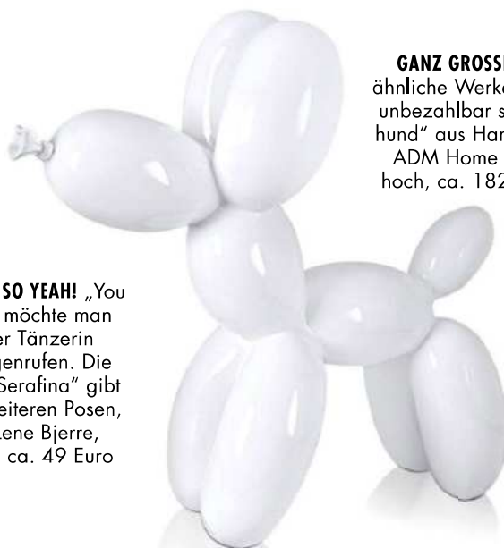
GANZ GROSSE KUNST Während ähnliche Werke berühmter Künstler unbezahlbar sind, ist der „Ballonhund“ aus Harz recht günstig, von ADM Home Collection, 27 cm hoch, ca. 182 Euro, Home24.de