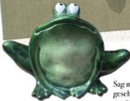
Sag mal Quak! Süßer Deko-Frosch, gesehen im Gartencenter Lenders, um 13,50 Euro