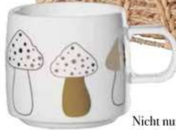
Nicht nur für Pilzfans ein tolles Fundstück: Tasse von ASA Selection, um 12 Euro