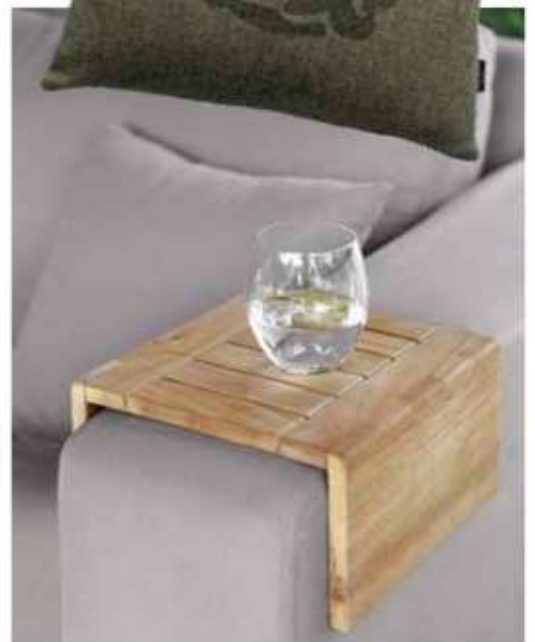
Endlich was zum Abstellen: Armlehnabtebrett aus Teakholz, von Fink, um 60 Euro