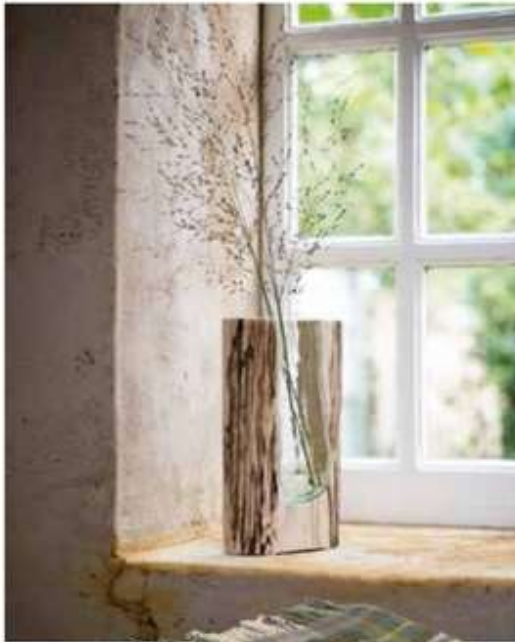
Blick fürs Wesentliche: Vase aus Holz mit Glas, von Leonardo, um 35 Euro