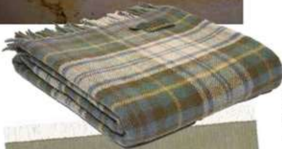
Kuschelklassiker: Wolldecke mit Tartan-Karomuster, von Gustavia, um 75 Euro