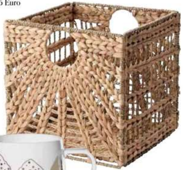
Alles Natur: handgearbeiteter Korb aus klar lackierten Pflanzenteilen, von Ikea, um 10 Euro