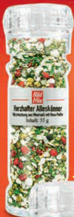
Mit natürlichem Meersalz, Rosa Pfeffer und feinen Kräutern