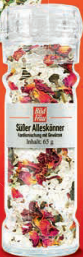
Mit weißem Kandis, Zimtblüten, Kardamomsaat und Rosenblättern

Herzhafter Alleskönner Perfekt zum Würzen von Kartoffel- und Gemüsegerichten sowie Eintöpfen und Fleisch. € 7,80