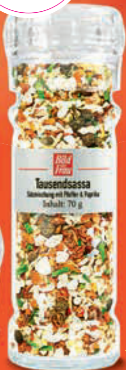
Mit natürlichem Meersalz, roter Paprika und edlem Kubebenpfeffer