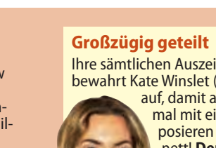
Großzügig geteilt Ihre sämtlichen Auszeichnungen bewahrt Kate Winslet (42) im WC auf, damit alle ihre Gäste mal mit einem Oscar posieren können. Wie nett! Der Star im TV: Der Vorleser, ARTE, 20.15 Uhr

Love is in the air! Nicht nur zum Valentinstag sind Geschenke mit Herz willkommen: Dekoobjekt aus Metall (7 €, Ernsting's family). Das Kissen lockert jede Sitzgelegenheit auf (89 €, Desiary). Mit dem Füllhalter Campus Line gehen Liebesbriefe flugs von der Hand (13 €, Online-Pen). Die Kombitasse „Hearts“ gehört zum 6-tlg. Set von Hutschenreuther (90 €). Geheimnisse hält das Tagebuch mit Lederhülle fest (59 €, Desiary).