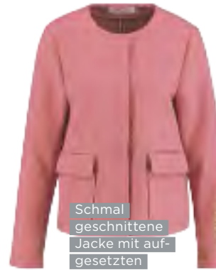
Schmal geschnittene Jacke mit aufgesetzten Taschen von Gerry Weber, ca. 130 Euro