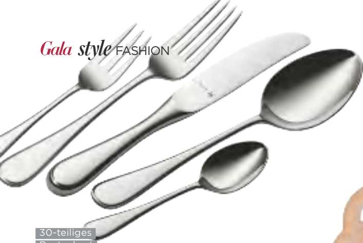
30-teiliges Besteckset „Kent“ aus Cromargan von WMF, ca. 160 Euro