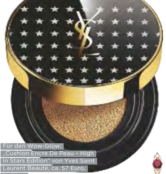
Für den Wow-Glow: „Cushion Encre De Peau - High In Stars Edition“ von Yves Saint Laurent Beauté, ca. 57 Euro, limitiert