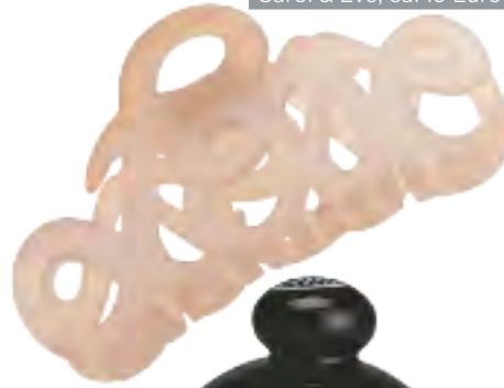
All you need is love: Haarklammer „Love“ von Carol & Eve, ca. 19 Euro