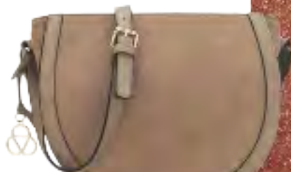
Veloursledertasche aus der „My Cashmere Moments by Gala“-Kollektion, über Hse24.de, ca. 90 Euro