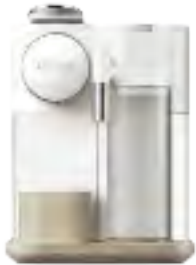
Mit Milchaufschäumer: Kaffeemaschine „De Longhi Gran Lattissima“ von Nespresso, ca. 400 Euro

Mir wird ganz weihnachtlich ... ... wenn im Gottesdienst der Schlusstriller von ‚Oh du Fröhliche‘ ertönt. Gänsehaut! Jedes Jahr wieder.