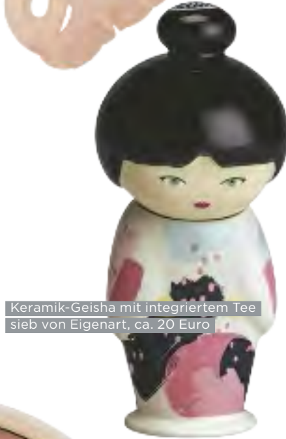
Keramik-Geisha mit integriertem Teesieb von Eigenart, ca. 20 Euro

Liebste Tradition: Am 25.12. morgens im Schlafanzug vorm Tannenbaum alle Geschenke ansehen. Musik beim Baum-schmücken: „Wonderful Dream“ von Melanie Thornton.