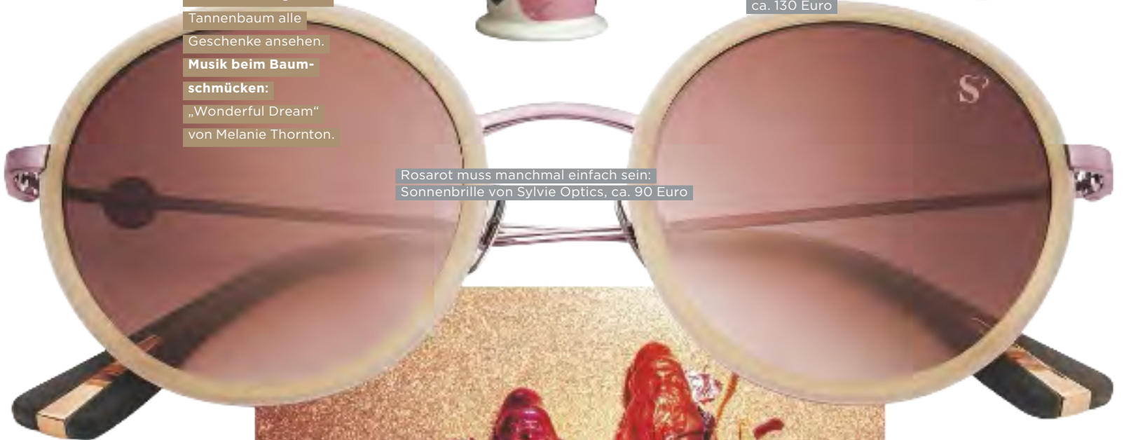
Rosarot muss manchmal einfach sein: Sonnenbrille von Sylvie Optics, ca. 90 Euro